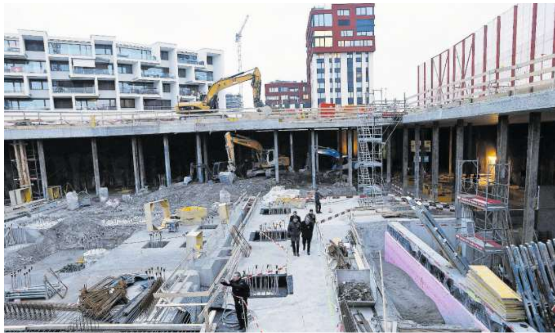
Grundsteinlegung bei der Suurstoffi in Rotkreuz.