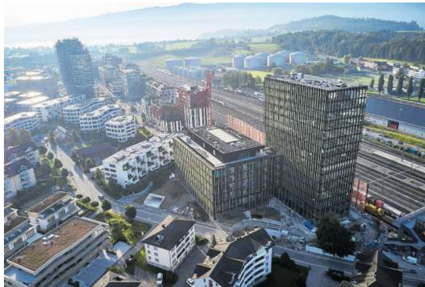
Das Hochhaus Arbo in Rotkreuz (vorne) ist das höchste Holz-Hybridgebäude der Schweiz.

Nicht nur die Konstruktion besteht zu einem wesentlichen Teil aus